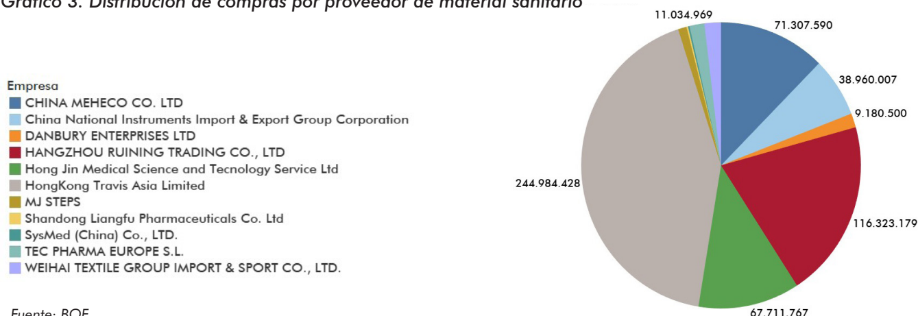
Gráfico 3. Distribución de compras por proveedor de material sanitario

centralizan, y en otros, no. Decía Myrdal que la intercalación de ejemplos no sirve para demostrar nada, pero estos apuntan a cuál es la tónica habitual de la Administración, que no es posible describir por falta de tiempo, de espacio y de transparencia por parte de esta. A continuación, presentamos una lista completa de los 77 contratos, con la información más relevante, hasta el 14 de mayo de 2020. Aunque no vamos a comentar cada uno de ellos, sí llaman de nuevo la atención varios detalles que vuelven a poner sobre la mesa la ineptitud del Gobierno en materia de gestión. En primer lugar, algo más del 20% de los proveedores del Ministerio de Sanidad fueron en un principio desconocidos. Pero lo peor radica en el valor de las contrataciones realizadas: ascendía a 577.134.223 euros. Esto significa que un 54,2% de todo el suministro corría a cargo de empresas en las que, según el propio BOE, España figuraba como país de residencia. Pero luego tuvieron que modificarlo (el 12 de mayo) para poner China. Era difícil que una empresa finalizada en LTD formara parte de nuestro tejido productivo, pero sin duda el Ejecutivo tenía que intentarlo.