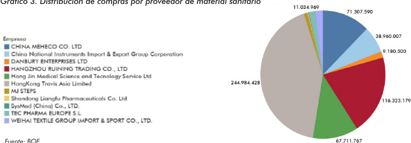
Gráfico 3. Distribución de compras por proveedor de material sanitario

centralizan, y en otros, no. Decía Myrdal que la intercalación de ejemplos no sirve para demostrar nada, pero estos apuntan a cuál es la tónica habitual de la Administración, que no es posible describir por falta de tiempo, de espacio y de transparencia por parte de esta. A continuación, presentamos una lista completa de los 77 contratos, con la información más relevante, hasta el 14 de mayo de 2020. Aunque no vamos a comentar cada uno de ellos, sí llaman de nuevo la atención varios detalles que vuelven a poner sobre la mesa la ineptitud del Gobierno en materia de gestión. En primer lugar, algo más del 20% de los proveedores del Ministerio de Sanidad fueron en un principio desconocidos. Pero lo peor radica en el valor de las contrataciones realizadas: ascendía a 577.134.223 euros. Esto significa que un 54,2% de todo el suministro corría a cargo de empresas en las que, según el propio BOE, España figuraba como país de residencia. Pero luego tuvieron que modificarlo (el 12 de mayo) para poner China. Era difícil que una empresa finalizada en LTD formara parte de nuestro tejido productivo, pero sin duda el Ejecutivo tenía que intentarlo.